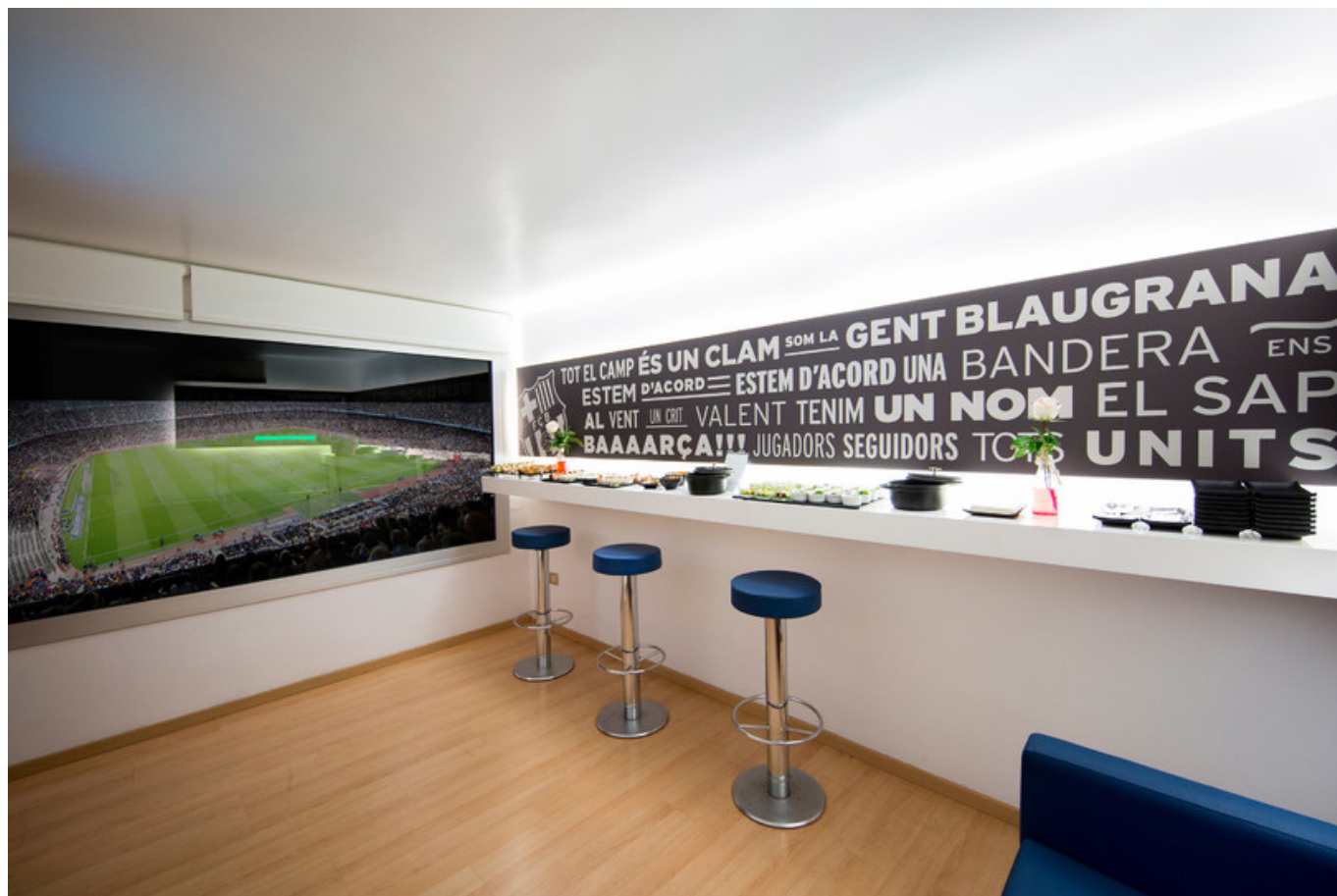
Una de les 'sky boxes' (un tipus de llotja privada del Camp Nou) per dins

Però, més enllà de les relacions institucionals a escala local, el Barça també exerceix certa diplomàcia internacional . A l'agost del 2013, el club va fer l'anomenat ' Peace Tour ', que oficialment buscava "enfortir els llaços entre palestins i israelians", i que va comportar visites a l'aleshores president hebreu, Shimon Peres, i al president de l'Autoritat Nacional Palestina, Mahmud Abbas. El 2015 va assistir a l'estadi James Costos, aleshores ambaixador dels Estats Units a Espanya. La visita era prèvia a la inauguració de l' oficina del club a Nova York .