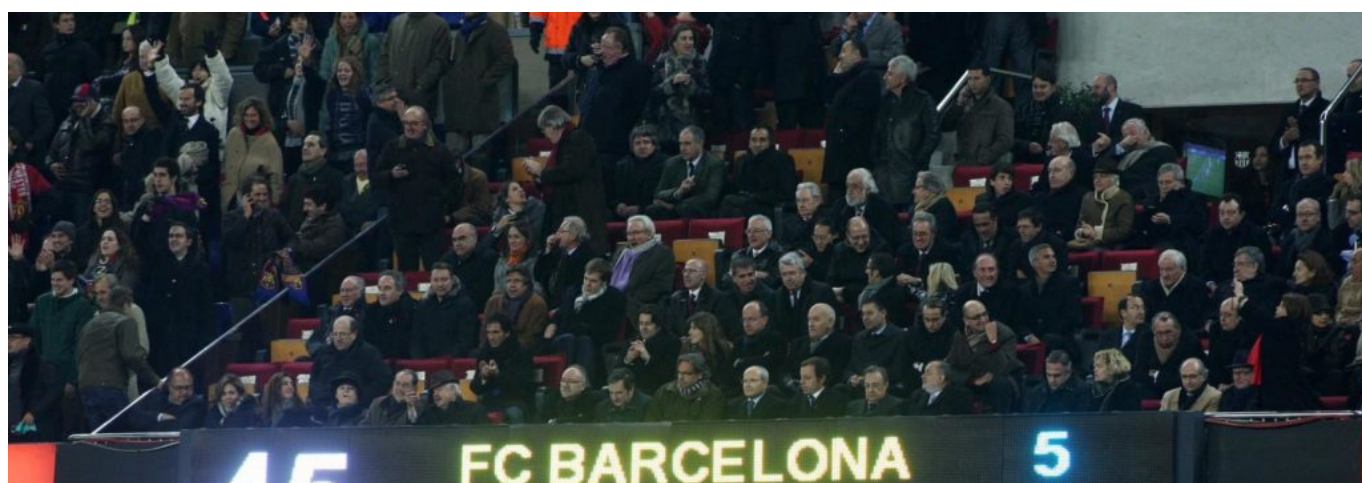
Imatge de la llotja presidencial un dia de partit

Precisament per això, una de les prioritats de la reforma del Camp Nou és augmentar el nombre de seients i llotges VIP, destinades a visitants de gran poder adquisitiu i a grans empreses. La millora també preveu engrandir les llotges privades i dotar-les d'una major comoditat, cosa que pot facilitar determinades trobades. Les obres, incloses en l'anomenat Espai Barça, començaran a l'estiu del 2019, després de rebre l' aprovació municipal . La rendibilitat que donarà aquesta ampliació de llotges al club la resumeix així el periodista de l'Agència Efe Àlex Santos, que cobreix la informació del club des de fa més de dues dècades: "En el futbol actual té una importància cabdal que puguis tenir moltes llotges privades, perquè són una font d'ingressos i, alhora, permeten que hi vagin els patrocinadors i facin els seus negocis".