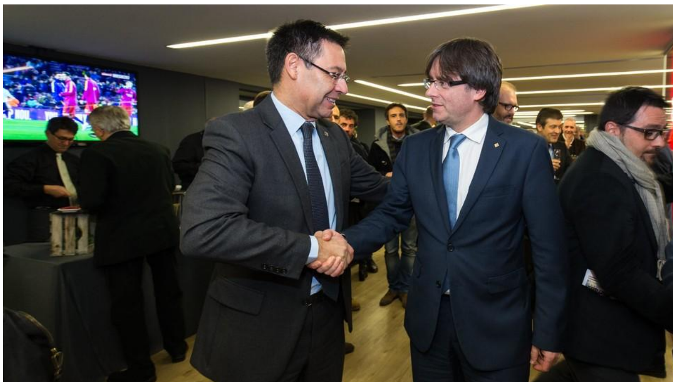
Josep Maria Bartomeu i Carles Puigdemont a la llotja del Camp Nou