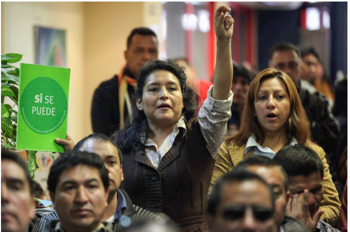
Reunió a Madrid de persones migrades afectades per la crisi hipotecària

“Els immigrants no volen integrar-se”. El tòpic és encara un dels estereotips més reproduïts sobre la població d'origen estranger. Però, és cert? Quina és la salut de la convivència a casa nostra? CRÍTIC analitza diversos rumors racistes que posen en qüestió les polítiques d'integració i acollida a Catalunya i aporta fonts, reflexions i dades.