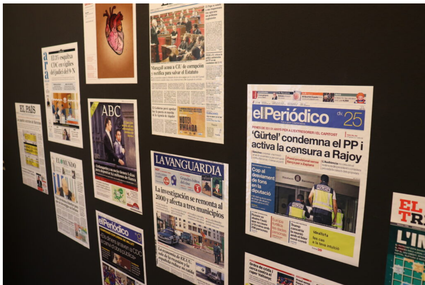
Portades de diaris dedicades a la corrupció

A l'àmbit 'Què és la corrupció' s'esmenten els riscos de corrupció en l'espai públic i també la transparència i els mecanismes de detecció d'alguns països del nord d'Europa, amb un recorregut molt llarg en aquest àmbit, en comparació amb països com Espanya, amb mecanismes de control posteriors al restabliment de la democràcia. També s'hi fa esment de la corrupció en l'àmbit públic a Catalunya, amb casos concrets i coneguts per la ciutadania.