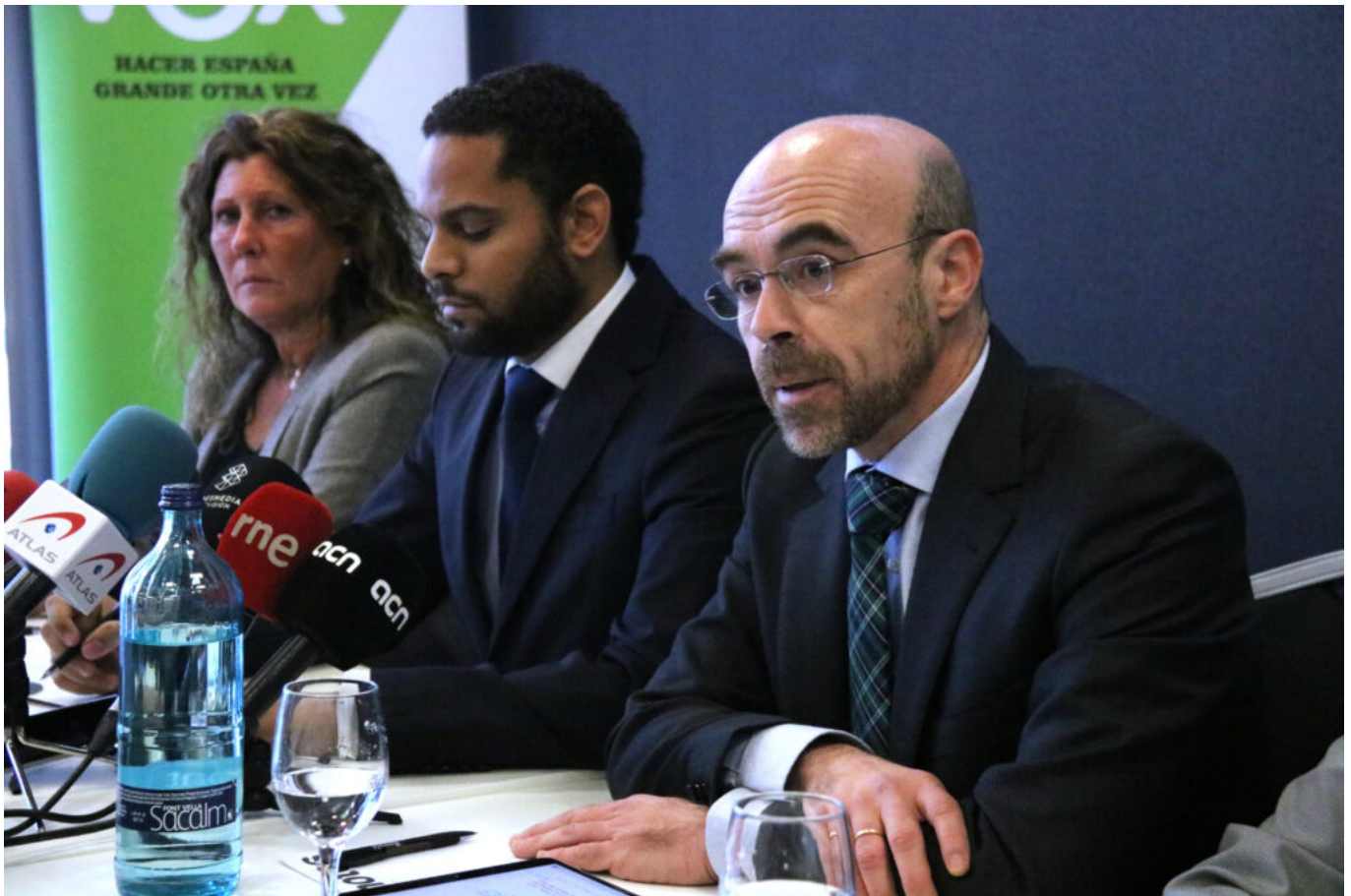
L'eurodiputat de Vox Jorge Buxadé (dreta), al costat d'Ignacio Garriga.